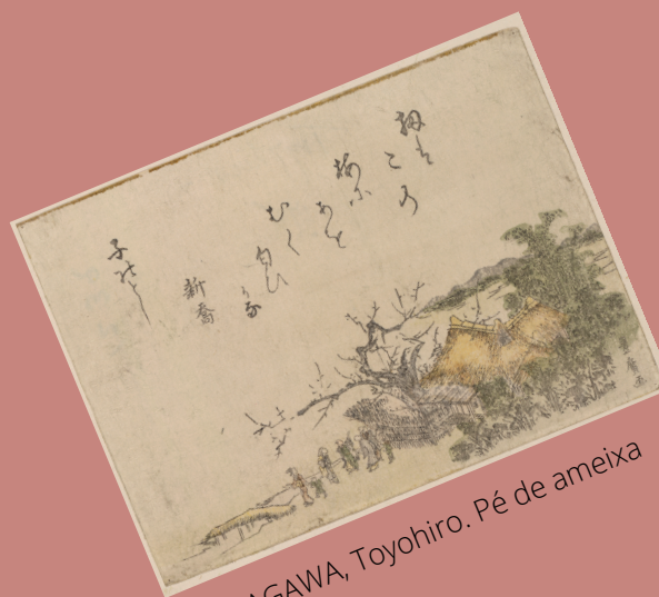
UTAGAWA, Toyohiro. Pé de ameixa

Outro recurso digital é a possibilidade de navegar por mapas interativos, onde é possível utilizando o recorte escolhido, observar todas as fontes disponíveis na biblioteca associadas a determinada região. Um exemplo é a possibilidade de poder navegar pelas iluminuras que compõe a coleção apenas exercendo um maior ou menor zoom no seu país de interesse.