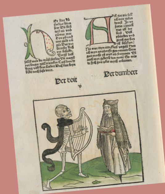
Dança da Morte