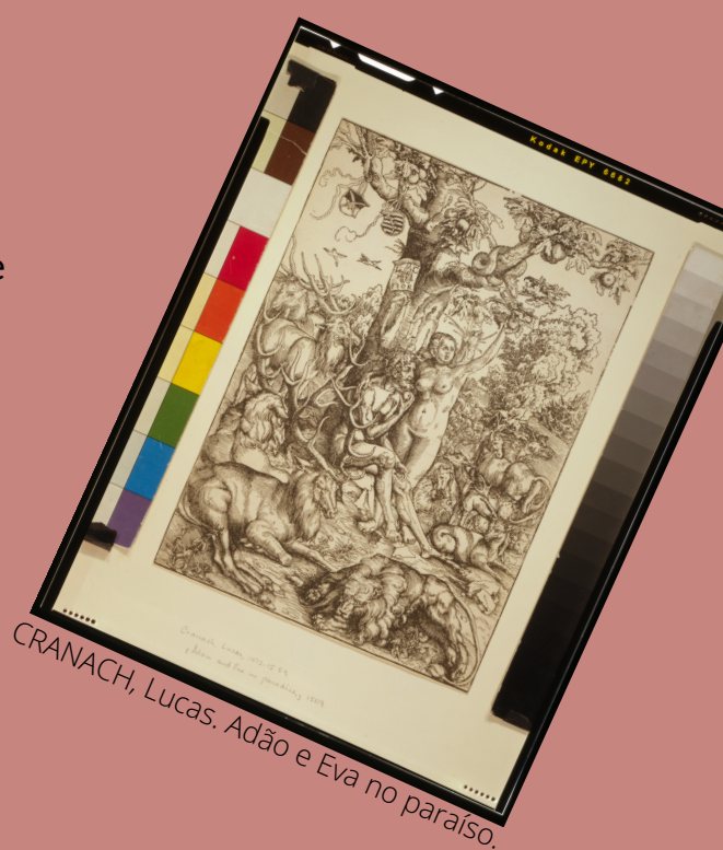
CRANACH, Lucas. Adão e Eva no paraíso.

Dentro de sua coleção é possível encontrar manuscritos, fotografias, pôsteres dentre outras fontes das mais diversas épocas dos registros humanos.