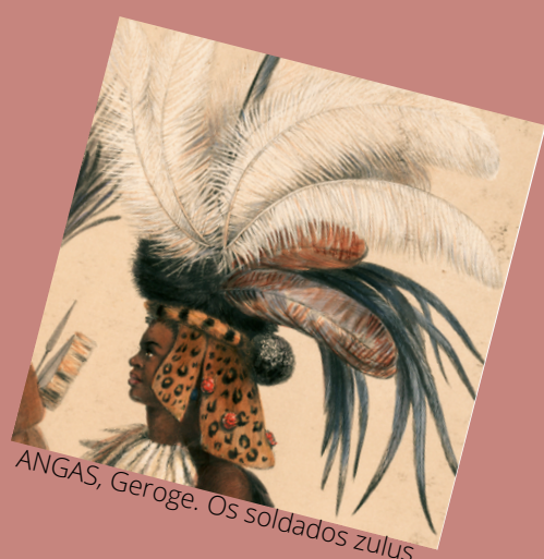
ANGAS, George. Os soldados zulus

Essa coleção se destaca não só pela quantidade de seus itens, uma vez que possui contribuições de diversas parcerias, mas também pela qualidade em sua curadoria e qualidade de digitalização, oferecendo imagens em alta resolução.